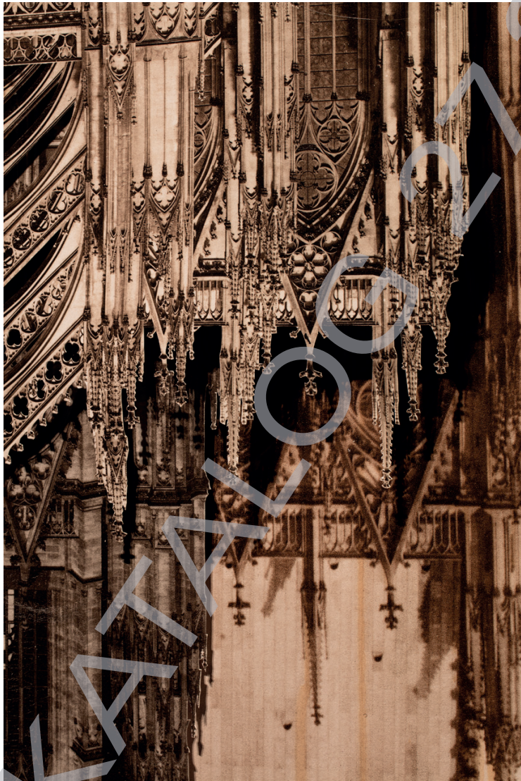
Søren Løse: Gothic deconstruction #1 (Köln), 2016 [detail]