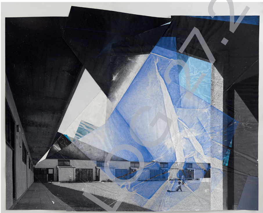
Julie Boserup: Exterior , 2016